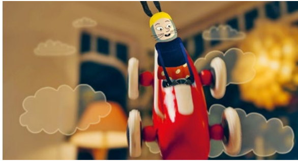
The Rumble-Bumble Rally

Gäste kommen, die Spielzeugautos liegen überall und Mathilde soll aufräumen. Zum Glück tauchen zwei winzige Fantasie-Freunde auf und machen daraus ein Rallye-Rennen durchs Wohnzimmer. Aufräumen als Wettbewerb? Auf die Plätze, fertig, los!