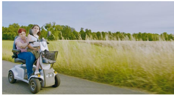
📌 Nele in den Wolken

Ein Musikvideo wie eine Achterbahn aus Bildern: Ein roter Mund startet den Ritt, dann entsteht ein Strudel aus Farben, Pflanzen, Tieren, Körperteilen. Alles wirkt vertraut und doch völlig verdreht in diesem poppigen Traumland.