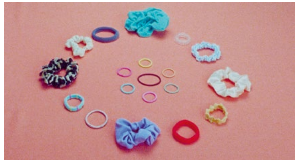
📌 Obey, obey

Aymara hat zwei Herkunftswelten, eine schweizerische und eine südamerikanische, und fühlt sich in keiner ganz zu Hause. Am deutlichsten zeigt es sich an ihren Haaren, die zum Ausdruck von Zugehörigkeit und Identität werden.