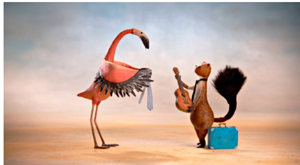
📍 oben: Auf meine Weise , mittig: Wilfrid Gordon McDonald Partridge , unten: Eine Gitarre am Meer