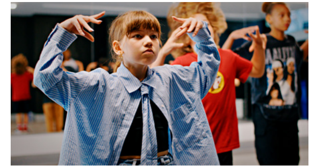
📍 Das Mädchen und die Riesin – Adeline tanzt Krump

Das Schulkind Léontine verbringt die Ferien bei Verwandten auf dem Land. Die perfekte Gelegenheit, um einen Streich nach dem nächsten zu spielen! Parfum, Töpfe, Obst, Gemüse, Stühle, Onkel, Tante, Koch und Gärtner – nichts und niemand ist vor ihr sicher.