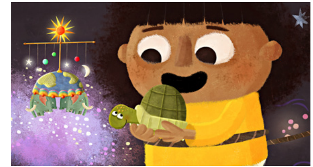
Klein Tut – Die Schildkröte

THEMEN: Unwahrscheinliche Freundschaften, Grenzen überwinden, Reisen und Abenteuer, Langeweile und Geduld, Neugier und Fantasie, Tiere und Natur