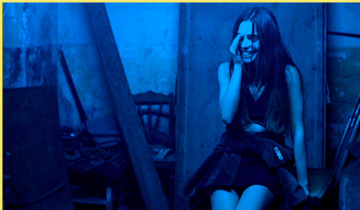
Clubbed to Death (Lola)